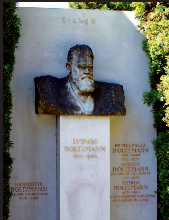
LA TOMBA DI LUDWIG BOLTZMANN A VIENNA (IMMAGINE DI PUBBLICO DOMINIO)